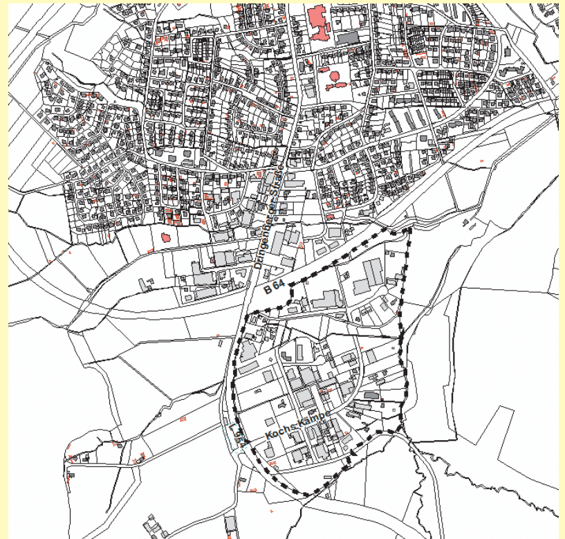
Geplanter Geltungsbereich des Bebauungsplanes BA03 „Diekbrede“

STADT BAD DRIBURG Der Bürgermeister Burkhard Deppe